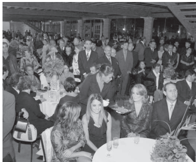
Uma panorâmica do salão de festas